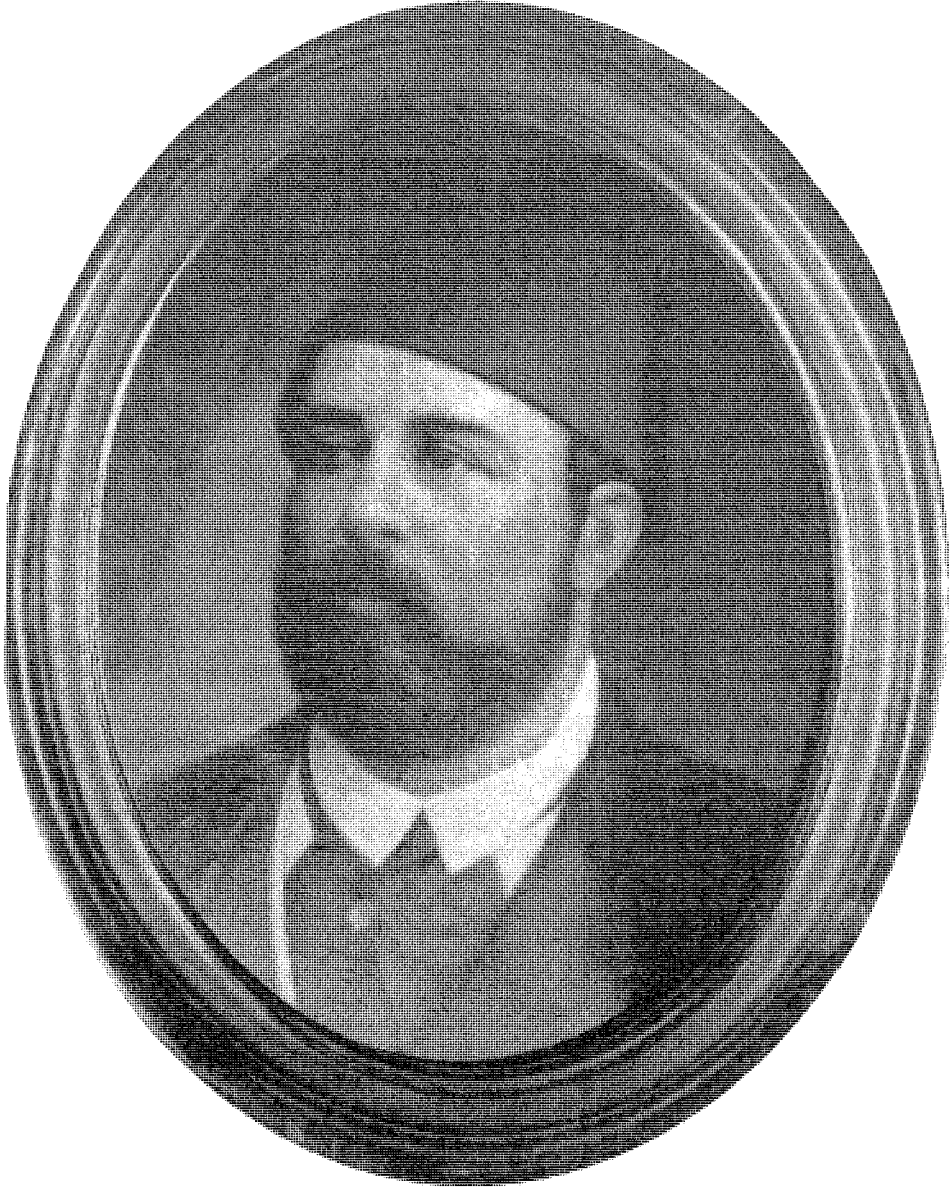
الخدّيو إسماعيل حقق حركة إصلاحية لكنّه وقع تحت إغراءات القروض